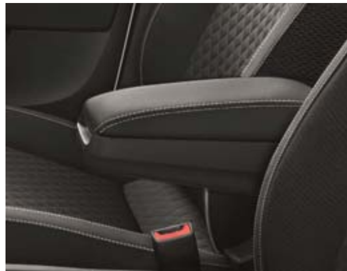
Sellerie spécifique tissu noir. Tapis de sol avant et arrière, petit pack cuir. Insert décoratif "Alu brossé" sur tableau de bord.