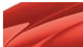
Rouge Rio (6X6X)