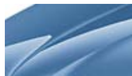
Bleu Denim (G0G0)