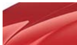
Rouge Corrida (8T8T)