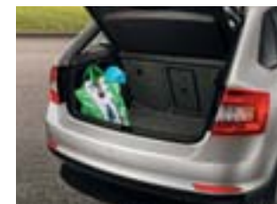
Coffre à bagages avec crochets d'attache.