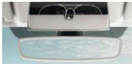
Rétroviseur intérieur électrochromatique et détecteur de pluie.