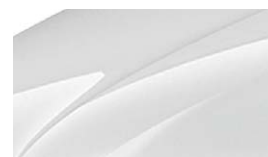
Blanc Cristal (9P9P)