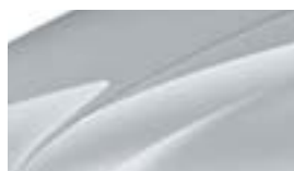
Gris Argent (8E8E)