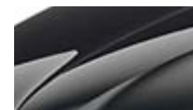
Noir Magic Nacré (1Z1Z)

La Rapid Spaceback Drive bénéficie d'un intérieur très qualitatif : insert type alu brossé et sellerie exclusive tissu noir spécifique. L'ensemble des éléments de carrosserie peints donne au véhicule un caractère statutaire accru.