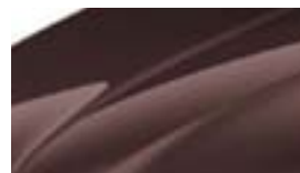
Marron Topaze (4L4L)