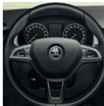
Volant cuir multifonctions radio / téléphone.