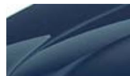
Bleu Pacifique (Z5Z5)