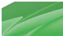
Vert Rallye (P7P7)