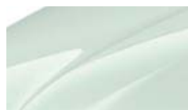
Blanc Laser (J3J3)