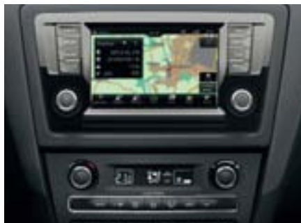
Système de navigation GPS "Amundsen" et climatisation automatique Climatronic®.