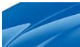
Bleu Racing (8X8X)