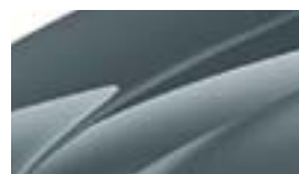
Gris Météore (F6F6)