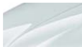
Blanc Lune (2Y2Y)