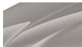
Beige Cappuccino (4K4K)