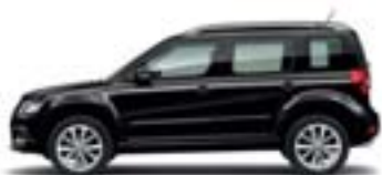
Noir Intense (2T2T)