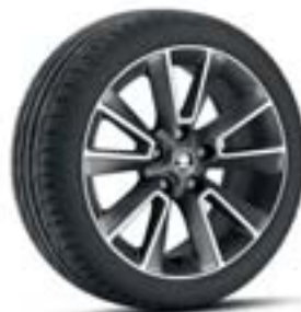
Jantes alliage 17" "Matterhorn".