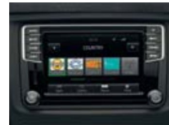
Radio Bolero, écran tactile et lecteur de carte SD, commande vocale couplée à la fonction Smartlink (incl Mirror Link 1.1 / Android Auto / Apple Carplay)