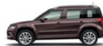
Marron Topaze (4L4L)