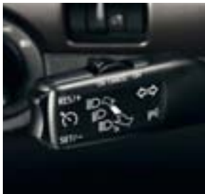
Régulateur de vitesse de série