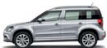
Gris Argent (8E8E)