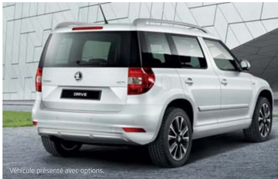
Véhicule présenté avec options.