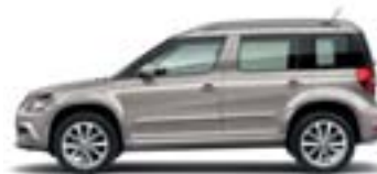
Beige Cappuccino (4K4K)