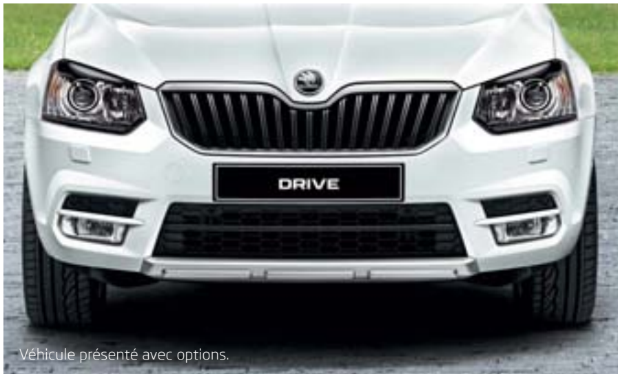
Véhicule présenté avec options.