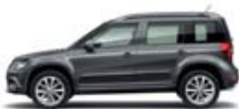
Gris Anthracite (2R2R)