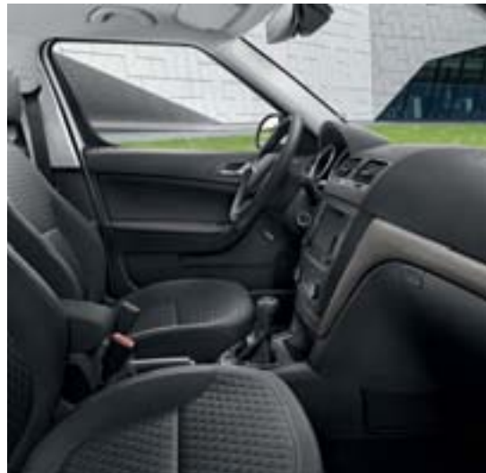
Sellerie spécifique noire tissu "Drive".