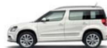
Blanc Pur (0Q0Q)