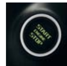
KESSY (système d'autorisation d'accès, de démarrage et d'arrêt du moteur mains-libres)