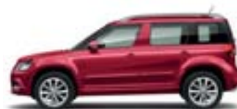
Rouge Rubis (7H7H)