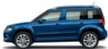
Bleu Tempête (8D8D)