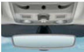
Pack visibilité (détecteur de pluie et de luminosité, rétroviseur intérieur électrochrome).